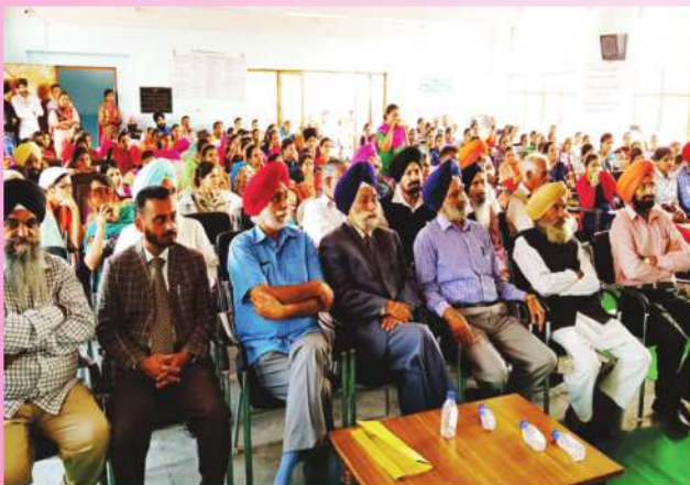
ਸਾਲਾਨਾ ਸਿੱਖਿਆ ਸਮਾਗਮ ਸਮੇਂ ਜੁੜੇ ਪੜਵੰਤੇ ਸੱਜਣ