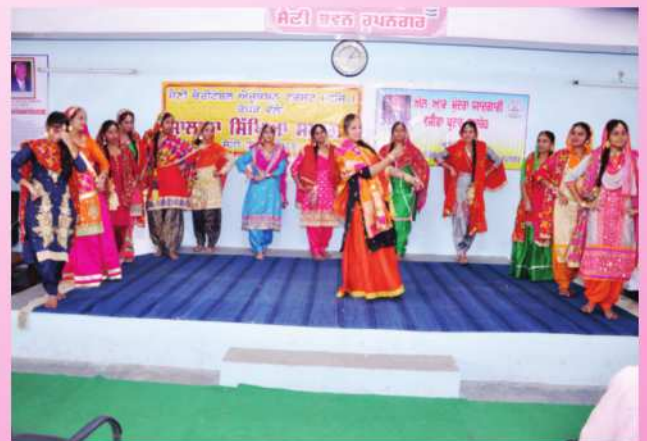
ਸਿੱਖਿਆ ਸਮਾਗਮ ਦੌਰਾਨ ਗਿੱਧਾ ਪੇਸ਼ ਕਰਦੀਆਂ ਸੈਣੀ ਭਵਨ ਦੀਆਂ ਸਿਖਿਆਰਥਣਾਂ