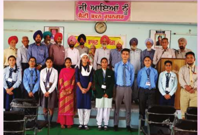
ਸਾਲਾਨਾ ਭਾਸ਼ਣ ਪ੍ਰਤਿਯੋਗਤਾ ਦੇ ਜੇਤੂ ਵਿਦਿਆਰਥੀ ਸੈਣੀ ਭਵਨ ਦੇ ਪ੍ਰਬੰਧਕਾਂ ਨਾਲ