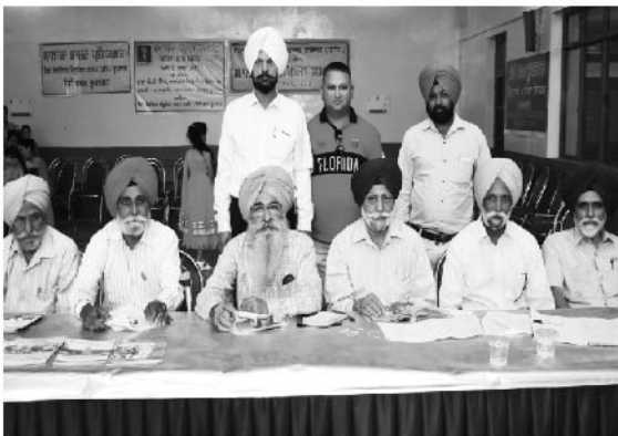
ਸੈਣੀ ਸੰਮੇਲਨ ਦੌਰਾਨ ਸੈਣੀ ਭਵਨ ਦੇ ਪ੍ਰਬੰਧਕਾਂ ਦੀ ਟੀਮ