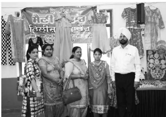
ਸੈਣੀ ਸੰਮੇਲਨ ਦੌਰਾਨ ਸੈਣੀ ਭਵਨ ਦੀਆਂ ਸਿਖਿਆਰਥਣਾਂ ਵਲੋਂ ਆਪਣੀਆਂ ਕਲਾਕ੍ਰਿਤੀਆਂ ਦੀ ਲਗਾਈ ਗਈ ਪ੍ਰਦਰਸ਼ਨੀ।