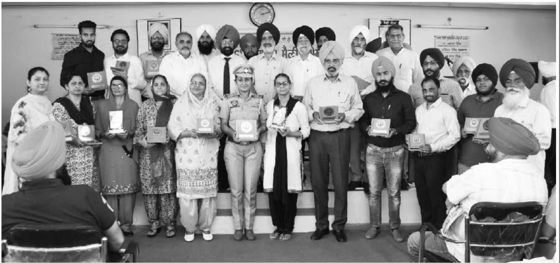
36ਵੇਂ ਸੈਣੀ ਸੰਮੇਲਨ ਦੌਰਾਨ ਸਨਮਾਨਿਤ ਸਫਲ ਸੈਣੀ ਸਖ਼ਸ਼ੀਅਤਾਂ