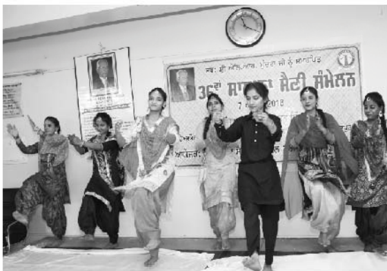
36ਵੇਂ ਸੈਣੀ ਸੰਮੇਲਨ ਦੌਰਾਨ ਸੱਭਿਆਚਾਰਕ ਪ੍ਰੋਗਰਾਮ ਪੇਸ਼ ਕਰਦੀਆਂ ਹੋਈਆਂ ਸੈਣੀ ਭਵਨ ਦੀਆਂ ਸਿਖਿਆਰਥਣਾਂ