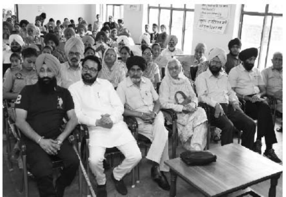
36ਵੇਂ ਸਾਲਾਨਾ ਸੈਣੀ ਸੰਮੇਲਨ ਸਮੇਂ ਹਾਜ਼ਰ ਸੈਣੀ ਬਰਾਦਰੀ ਦੇ ਪਤਵੰਤ ਸੱਜਣ