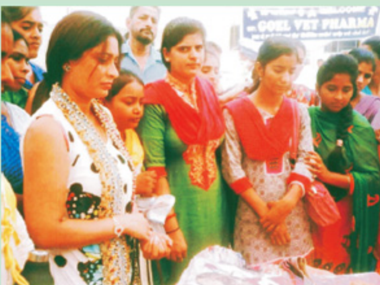
ਪੰਜਾਬੀ ਖੇਤੀਬਾੜੀ ਯੂਨੀਵਰਸਿਟੀ ਦੇ ਖੇਤਰੀ ਕੇਂਦਰ ਬੁੱਲੇਵਾਲ-ਸੋਖੜੀ ਵਿਖੇ ਆਯੋਜਿਤ ਪ੍ਰਦਰਸ਼ਣੀ ਦੇਖਦੀਆਂ ਹੋਈਆਂ ਸੈਣੀ ਭਵਨ ਦੀਆਂ ਸਿੱਖਿਆਰਥਣਾਂ