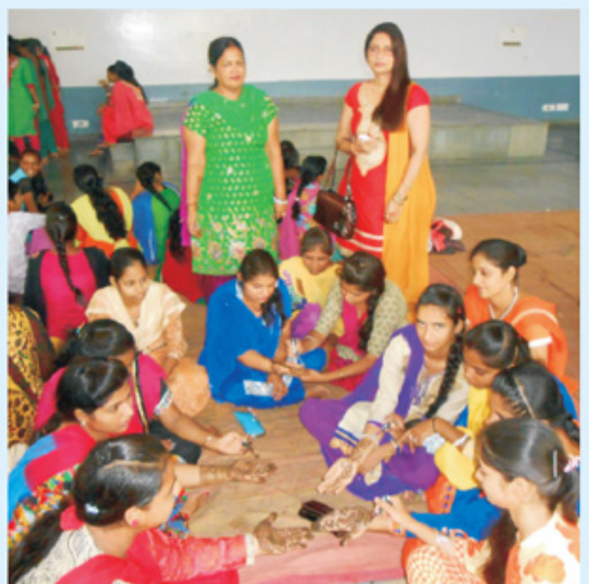
ਤੀਆਂ ਦੇ ਤਿਉਹਾਰ ਸਮੇਂ ਮਹਿੰਦੀ ਲਗਾਉਂਦੀਆਂ ਹੋਈਆਂ ਸੈਣੀ ਭਵਨ ਦੀਆਂ ਸਿੱਖਿਆਰਥਣਾਂ